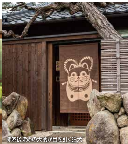
柿渋後染めの犬柄が目を引く拍犬

この度弊社カタログ「座」のVOL.18を発刊致しました。今回、初めての試みとなる「和モダン」テイストの座布団や、お問い合わせが多かったウレタン座布団のページを追加してお届けしております。また様々なご使用シーンに応じてのご希望に沿えるよう中味選びもし易くなるようまとめております。暖簾では生地毎の新色や新サイズ展開で更にお選び頂ける幅を増やしております。その他にも、抗菌や抗ウイルス生地を使用した座布団・暖簾や足枕(椅子席での足置き)、ソファーに腰かけた際の腰当て直わたクッション等、全ページにおいて見どころ満載なカタログに仕上がっております。さらに、今まで、別紙扱いで掲載していた価格も、商品ページに記載しており、便利になったと思います。こちらのカタログは随時お送りさせて頂いておりますので、お手元に届きましたら是非一度じっくりと御覧頂き、お問合せは営業担当まで宜しくお願い致します。