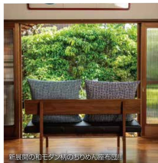
新展開の和モダン柄のちりめん座布団!!