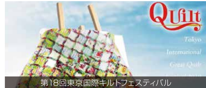
第18回東京国際キルトフェスティバル 2019年1月24日(木)～1月30日(水)

弊社も昨年に引き続き本年も「和・京都」が織りなす「本物」の素晴らしさを皆様へお届けに上がりますので、是非皆様のご来場をお待ちしております！