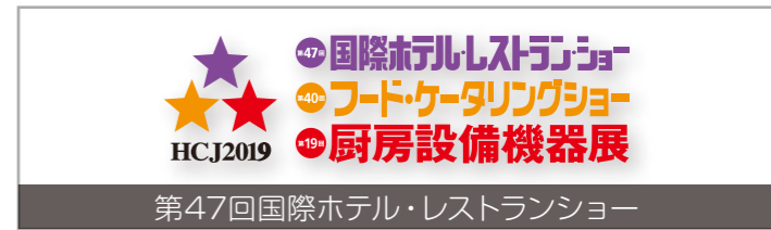
第47回国際ホテル・レストランショー 2019年2月19日(火)～2月22日(金)