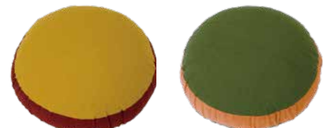
CRE0010 色あそび無地 YT(金茶)・GG(利休) 製品サイズ 径43cm×厚み13cm 上代価格 ¥8,700-(税抜き)

今回はお菓子のマカロンの様にコロんと愛らしい円筒ビーズ座布団のご紹介です。 異なる生地色を配色した無地の円筒ビーズ座布団や、座面や側面生地には、柄をあしらった、「花菱唐草」や「菊づくし」も無地とはまた違った可愛らしさを演出しています。掲載されている色・柄だけでなくご希望に合わせて製作できますので、オリジナルな円筒座布団も製作されてみてはいかがでしょうか？